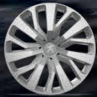
16" RAKIURA Jant Kapakları