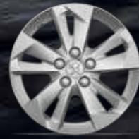
16" TARANAKI Alüminyum Alaşım Jant