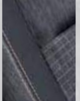
CASUAL turuncu dikişli kumaş döşeme