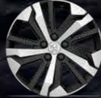
17" AORAKI Alüminyum Alaşım Jant