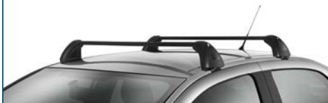
BELKI POPRZECZNE BAGAŻNIKA DACHOWEGO