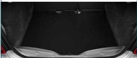
WYKŁADZINA BAGAŻNIKA DWUSTRONNA