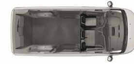
6.1 m 3 1,400 kg