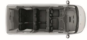
Triple fila de asientos para 9 pasajeros

SI NO ESTÁS SATISFECHO CON EL SERVICIO POST VENTA, PEUGEOT CUMPLE NO LO PAGAS.