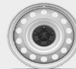
jante tabla 16"