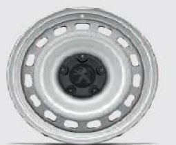
jante tabla 15"