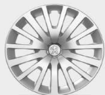
capace 15" Milford