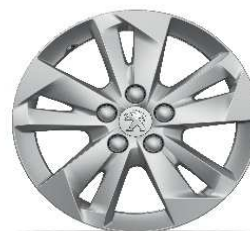
jante aliaj 16" TARANDAKI