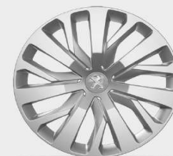
capace 16" Rakiura