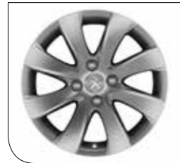
16" Managua Alüminyum jant

PEUGEOT ASSISTANCE : (0 212) 292 26 26 Peugeot Müşteri İlişkileri : (0 216) 579 94 44