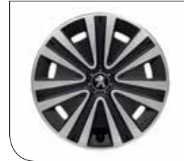
Nateo tipi 15" jant kapakları