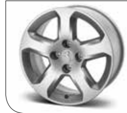
16" Arenal alüminyum jant