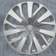
16" RAKIURA Jant Kapakları