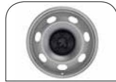
15" Yarım Jant Kapaklar