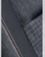
CASUAL turuncu dikişli kumaş döşeme